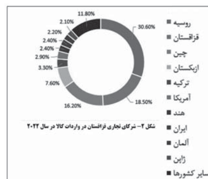
شکل ۲- ترکیب تجاری تاجیکستان در صادرات کل سال ۲۰۲۲

با این شرایط نرخ بیکاری تاجیکستان برابر ۷/۸ درصد است. پول تاجیکستان سومونی نام دارد و هر ۱۰/۹۵